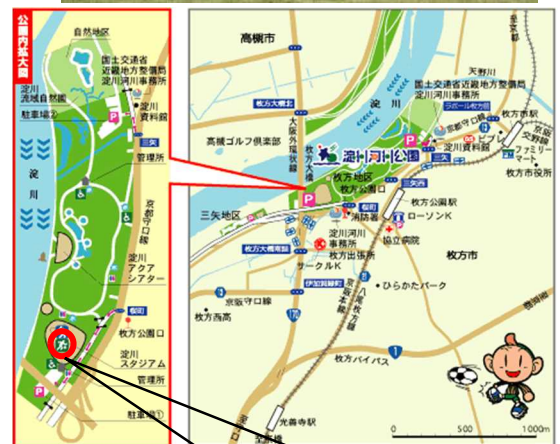
イベント会場「淀川スタジアム」